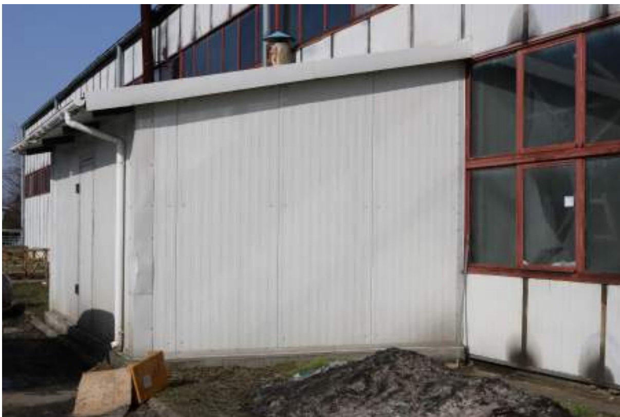
Fot. 3. Hala produkcyjna „EKO” – widok z zewnątrz