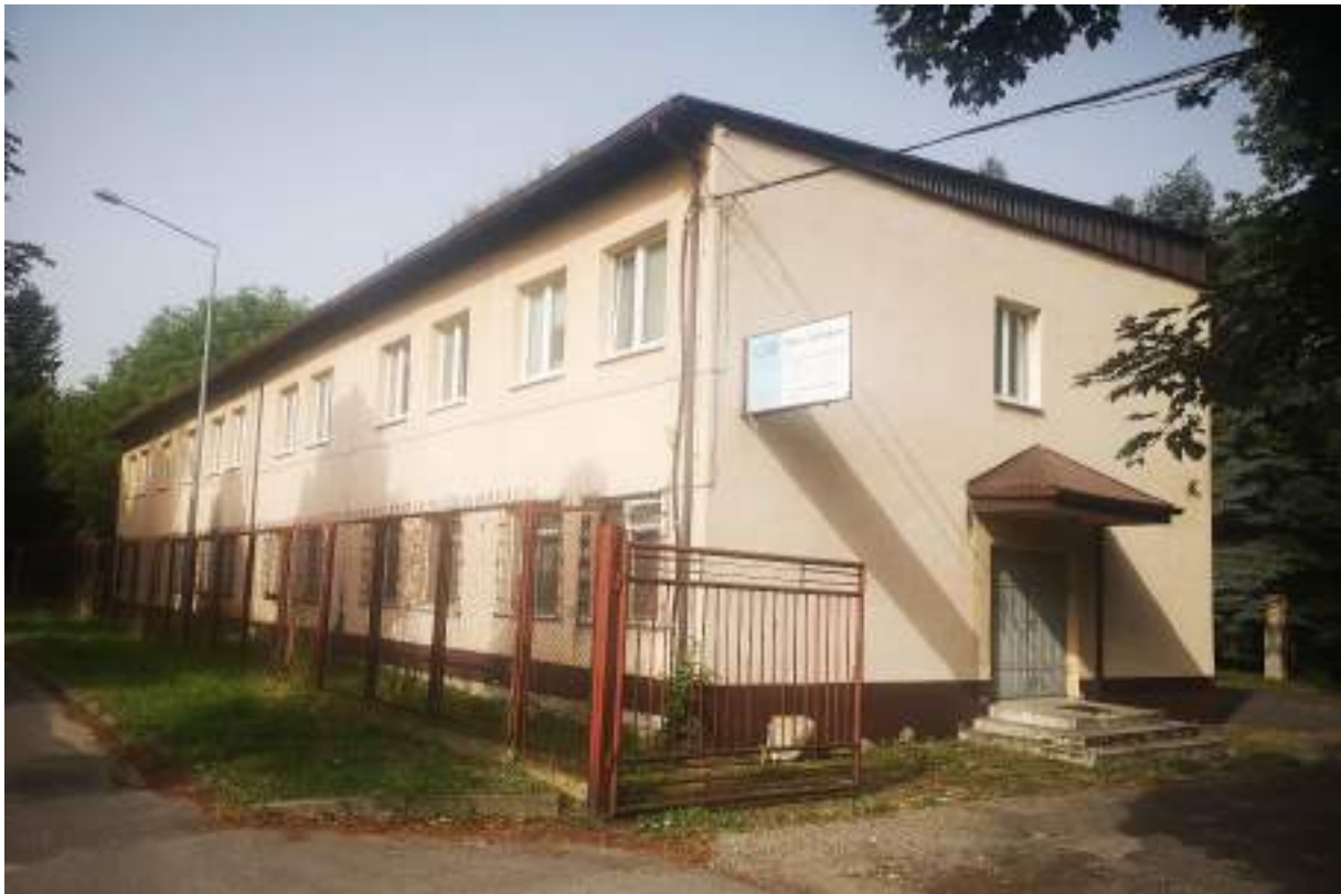
Fot. 25. Biurowiec – widok z zewnątrz