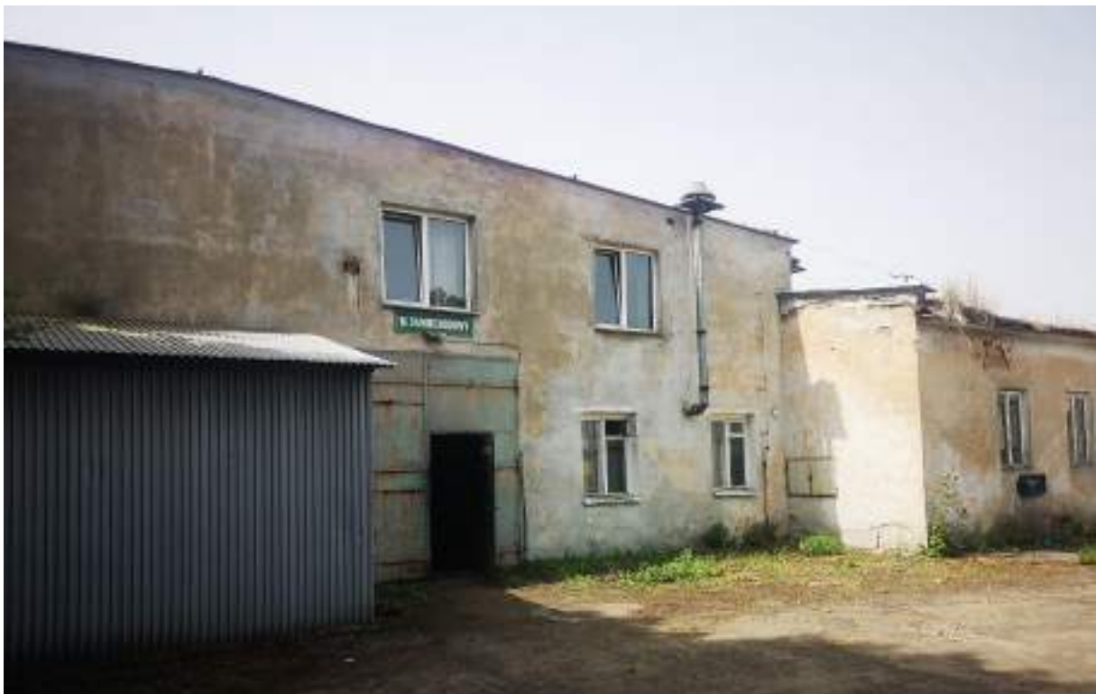
Fot. 18. Kompleks mechaniczny – widok z zewnątrz