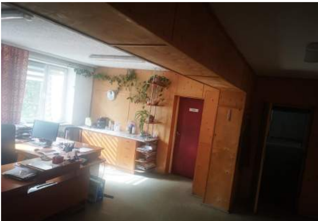
Fot. 26. Biurowiec – widok wewnątrz