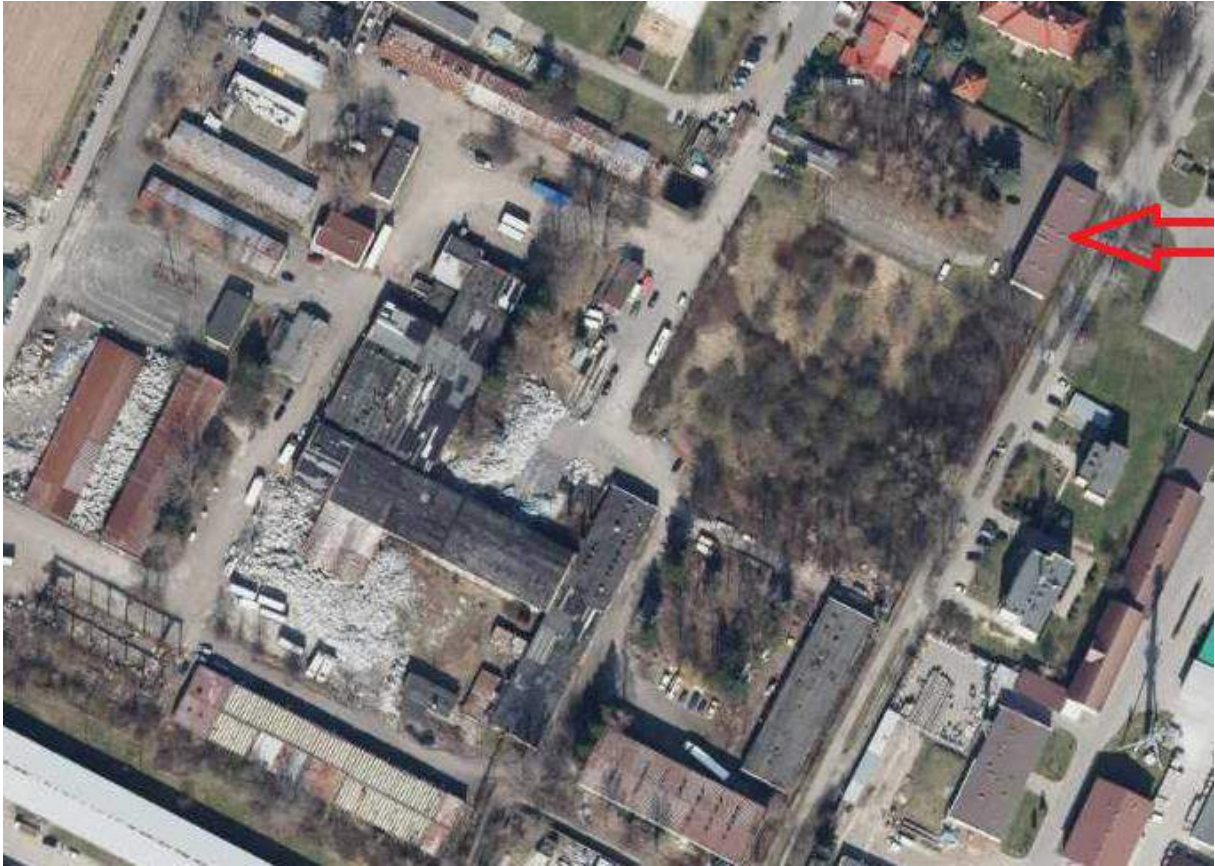
Fot. 24. Biurowiec – usytuowanie na terenie ZNS Sp. z o.o.