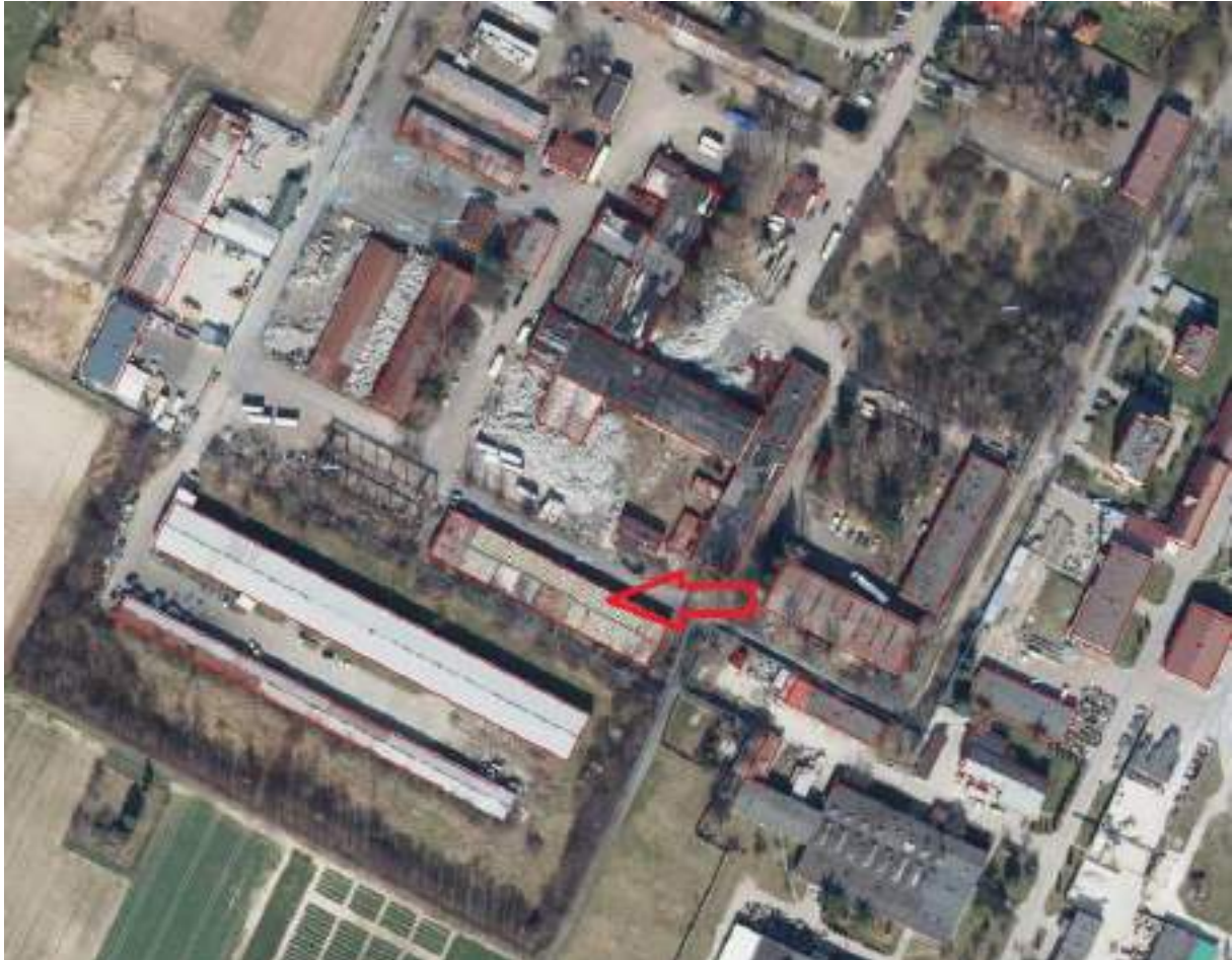
Fot. 6. Hala produkcyjna „ENVIRO” – usytuowanie na terenie ZNS Sp. z o.o.

Hala produkcyjna do wynajęcia z linią do produkcji rur i profili w zakresie średnic od 20 do 70 mm oraz z urządzeniami do szlifowania i polerowania powierzchni, a także z urządzeniami do produkcji metalowej. Istnieje możliwość sprzedaży samych urządzeń jak i wynajęcie hali bez urządzeń.