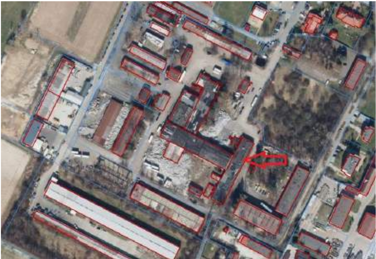
Fot. 9. Hala produkcyjna „REGE” – usytuowanie na terenie ZNS Sp. z o.o.