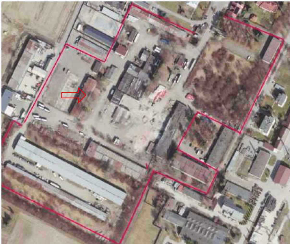
Fot. 13. Hala „ZĘBIEC” – usytuowanie na terenie ZNS Sp. z o.o.