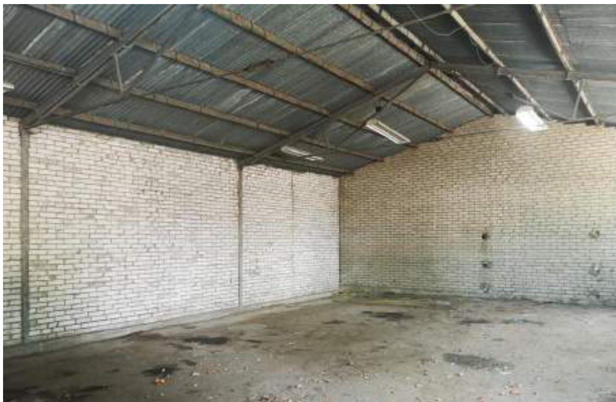
Fot. 23. Magazyn – widok wewnątrz