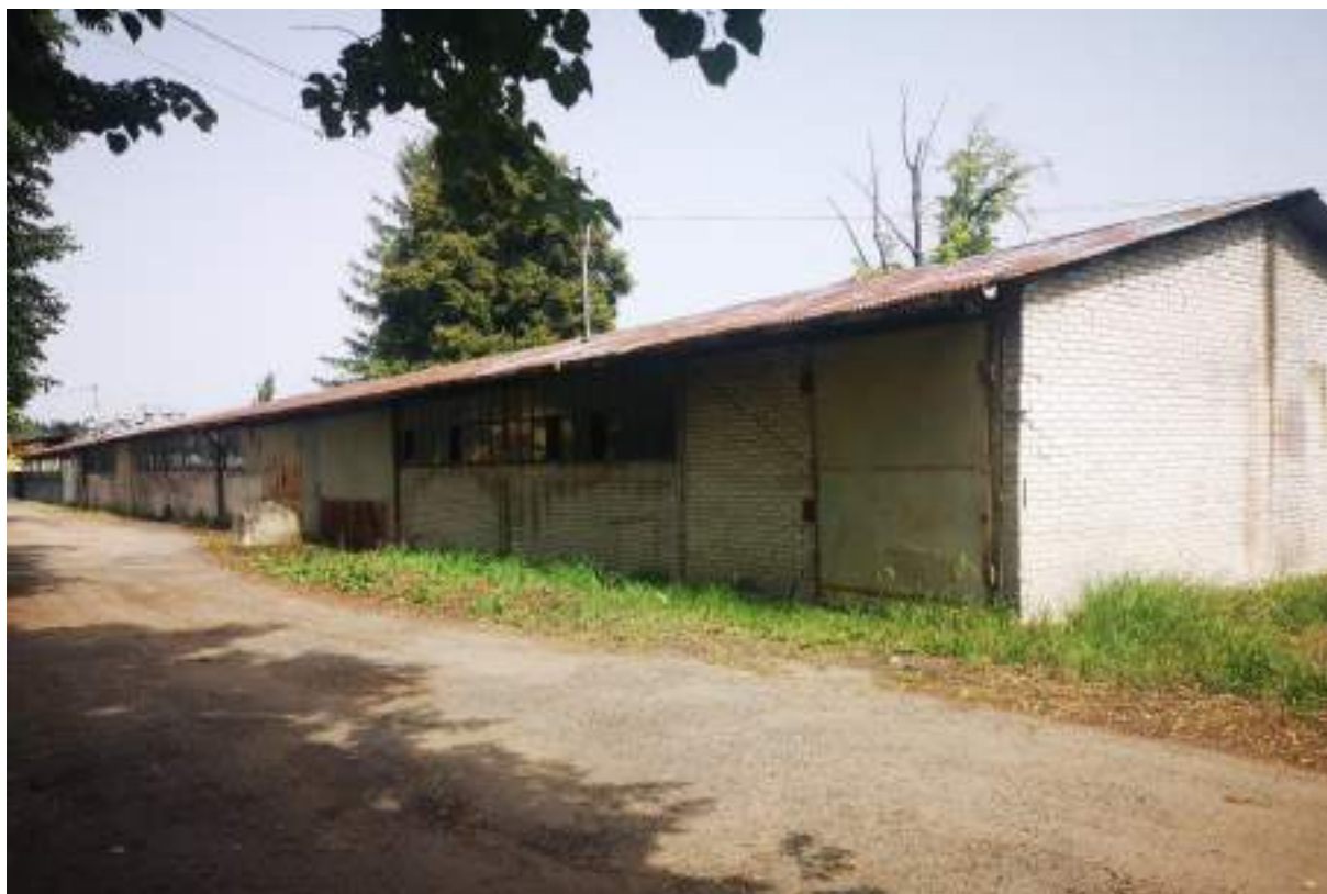
Fot. 22. Magazyn – widok z zewnątrz