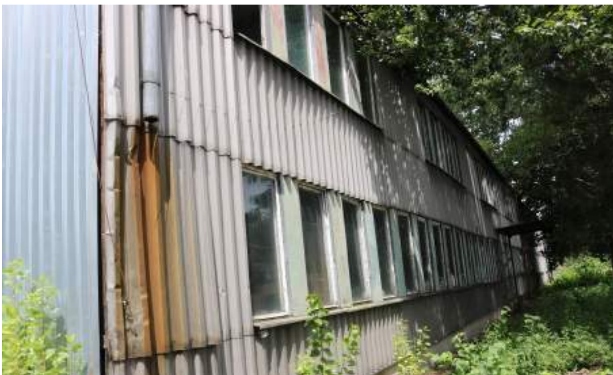
Fot. 15. Hala „ZĘBIEC” – widok z zewnątrz