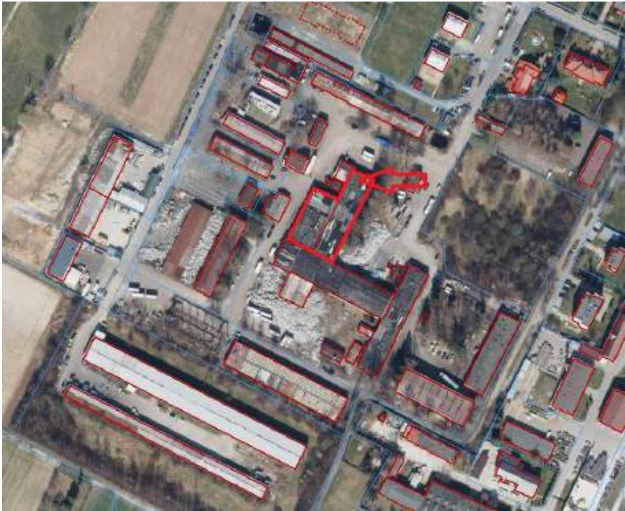
Fot. 16. Kompleks mechaniczny – usytuowanie na terenie ZNS Sp. z o.o.

Kompleks budynków mechanicznych wraz z kompletnym wyposażeniem w urządzenia do remontów wszystkich rodzajów silników, regeneracji podzespołów i całych pojazdów (wytaczarki poziome, wytaczarki pionowe, honownice, szlifierki do wałów korbowych, tokarki, wiertarki stołowe).