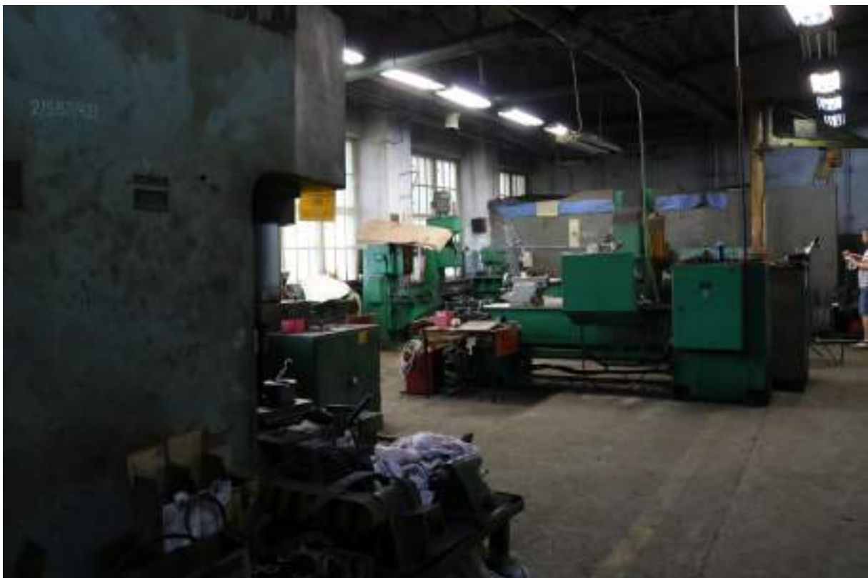
Fot. 20. Kompleks mechaniczny – widok wewnątrz