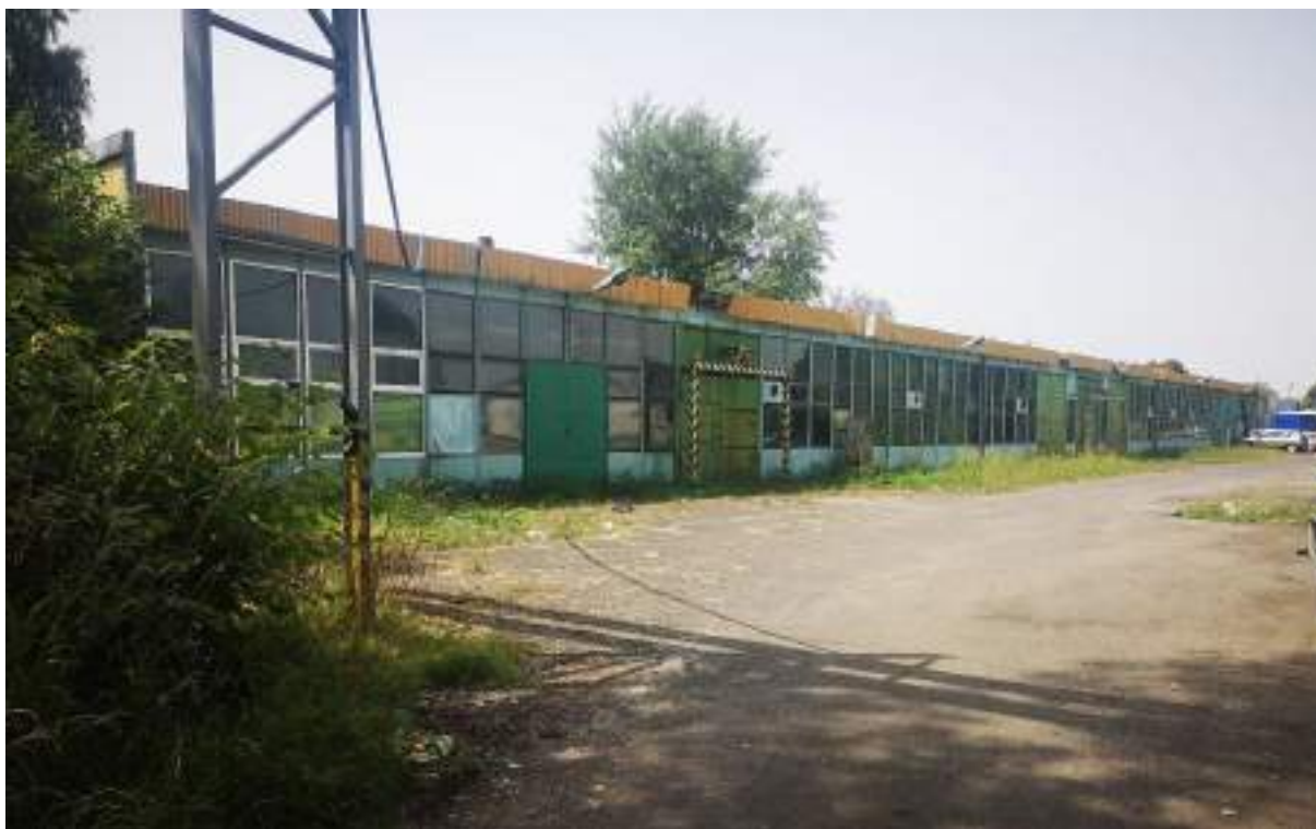
Fot. 7. Hala produkcyjna „ENVIRO” – widok z zewnątrz