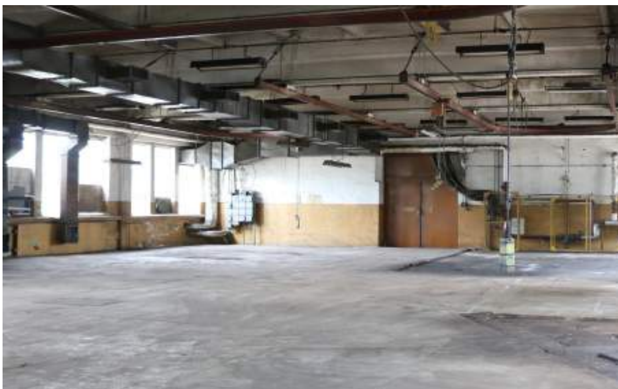
Fot. 11. Hala produkcyjna „REGE” – widok wewnątrz