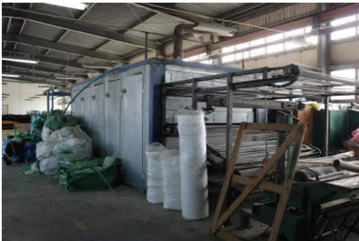
Fot. 4. Hala produkcyjna „EKO” – widok wewnątrz