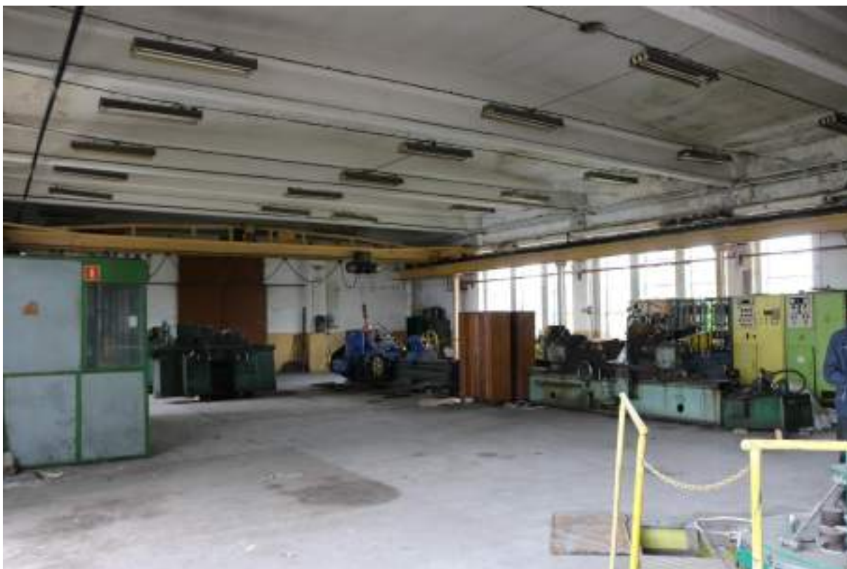
Fot. 12. Hala produkcyjna „REGE” – widok wewnątrz