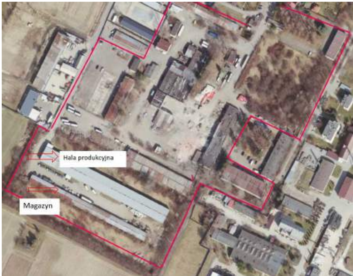
Fot. 2. Magazyn „EKO” + Hala produkcyjna „EKO” – usytuowanie na terenie ZNS Sp. z o.o.