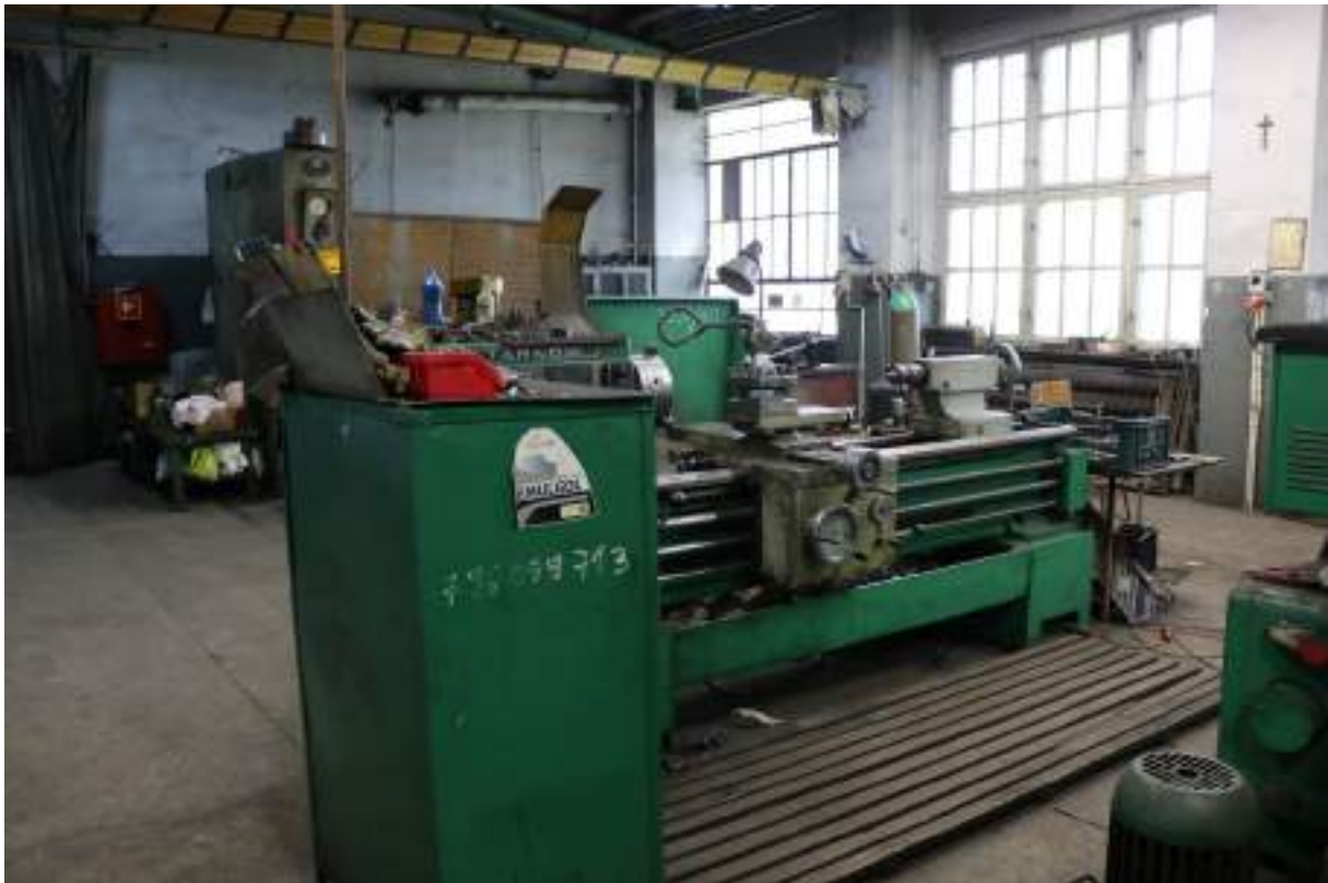
Fot. 19. Kompleks mechaniczny – widok wewnątrz