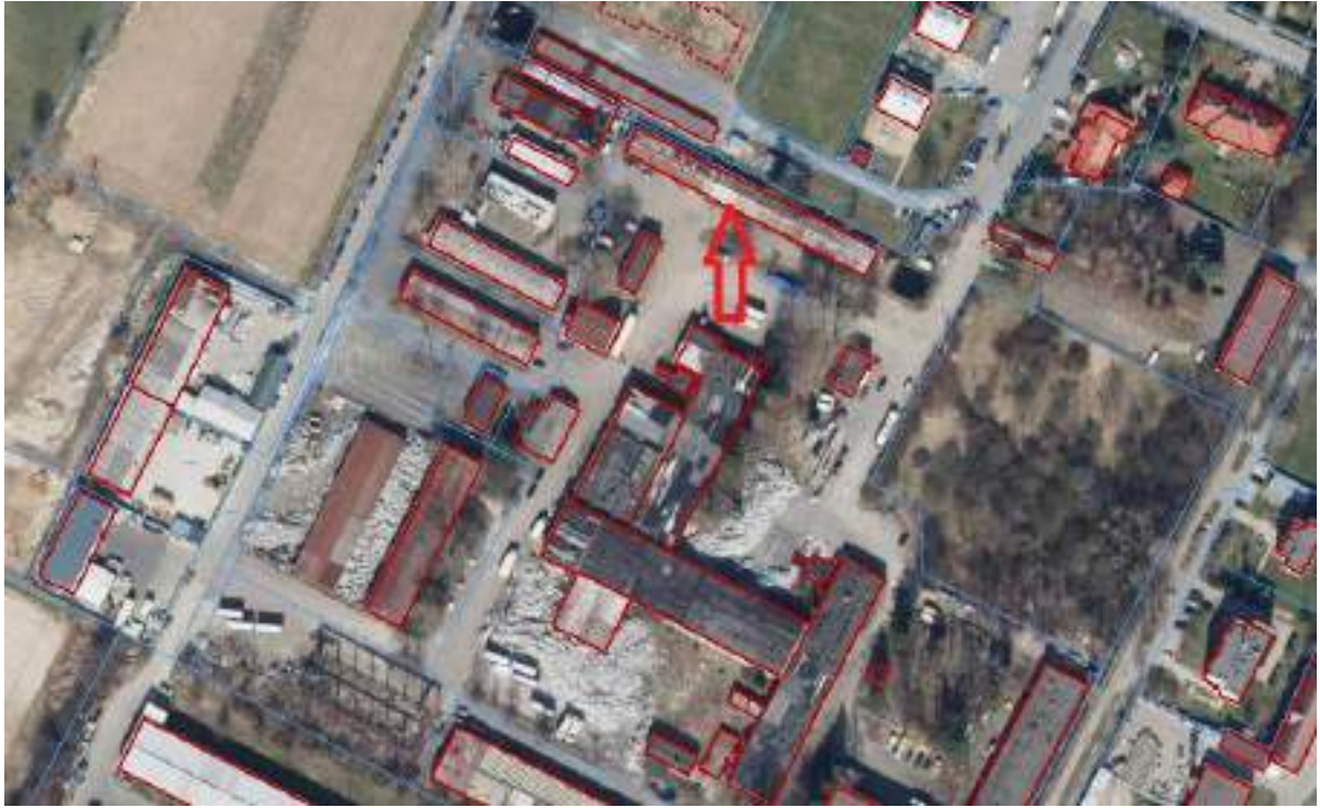
Fot. 21. Magazyn – usytuowanie na terenie ZNS Sp. z o.o.