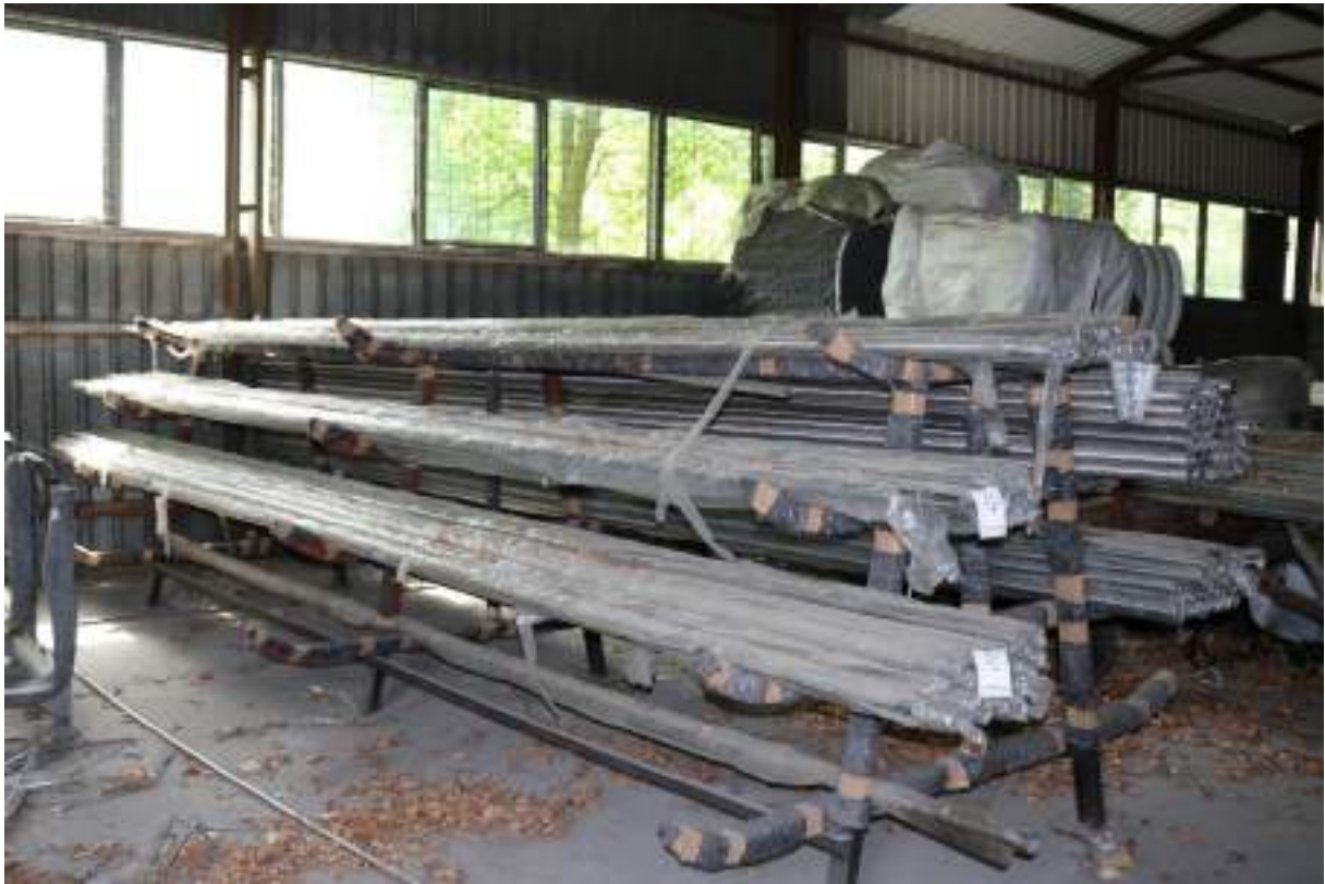
Fot. 5. Magazyn „EKO” - widok wewnątrz