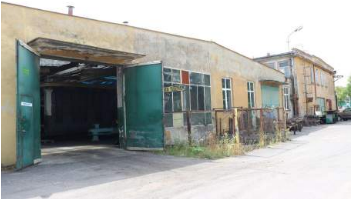
Fot. 17. Kompleks mechaniczny – widok z zewnątrz