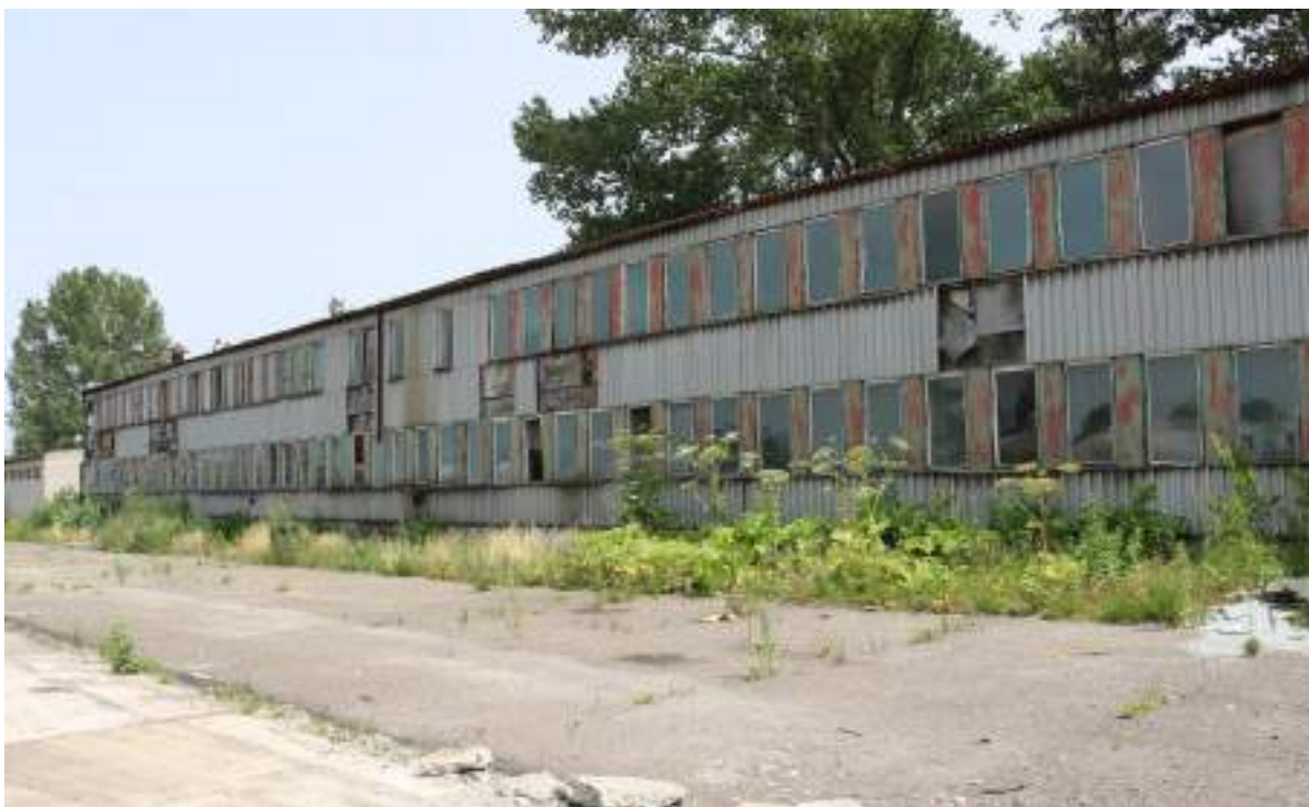
Fot. 14. Hala „ZĘBIEC” – widok z zewnątrz