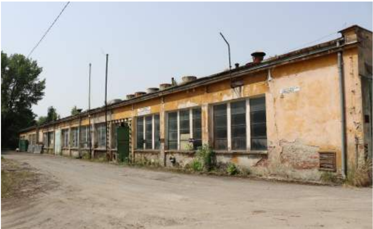
Fot. 10. Hala produkcyjna „REGE” – widok z zewnątrz