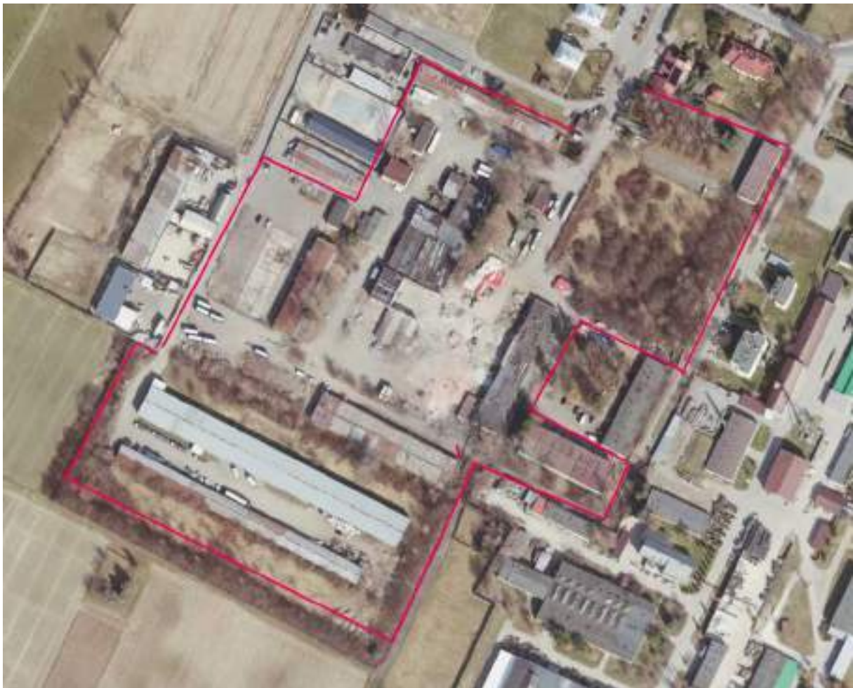
Fot. 1 Obrys terenu – Zakłady Naprawy Samochodów Sp. z o.o.